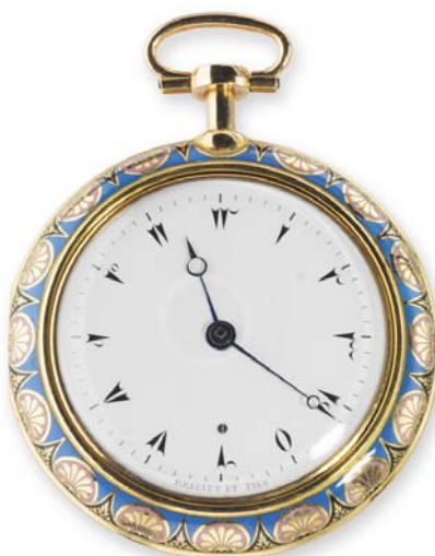
Caja Cara Dorso