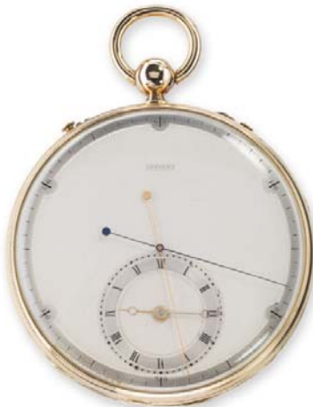
Breguet n°4009 Cronógrafo con doble segundero de observación. Antepasado de los cronógrafos modernos. Vendido en 1825 a M. Whaley. París, Museo Breguet