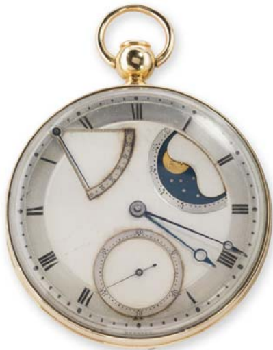
Breguet N° 5 Reloj perpetuo de repetición. Vendido al conde Journiac Saint-Méard en marzo de 1794. París, Museo Breguet

Esta exposición ha sido posible gracias al apoyo de Montres Breguet S.A.