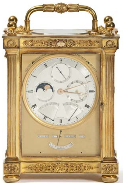
Breguet n° 3778 Reloj de viaje 24 x 15,5 x 9,5 cm. Caja de bronce, esfera de plata con decoración "guilloché", indicación del día y de la fecha. Vendido en 1842 a la princesa Demidoff Paris, Museo de las Artes Decorativas