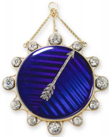
Breguet N° 611 cara Pequeño reloj medallón de tacto Fue propiedad de Joséphine Bonaparte París, Museo Breguet