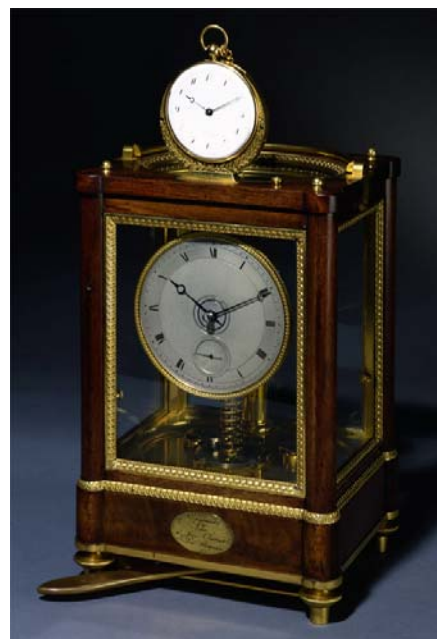
Breguet n° 666 et n° 721 Reloj "sympathique" y reloj Caja: H. 25,4 cm.; reloj: D. 6 cm. Caja de caoba acristalada en sus cuatro lados, esfera de plata y reloj sencillo Breguet no 721, caja de oro, esfera de esmalte. Vendido al príncipe-regente de Inglaterra (futuro rey Jorge IV) en agosto de 1814 Préstamo de Su Majestad la Reina Londres, The Royal Collection Trust