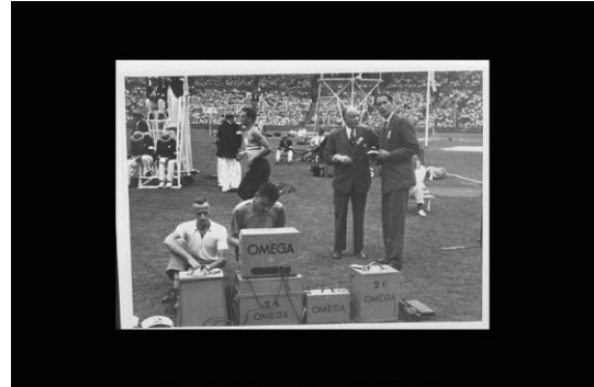
Londra 1948-La cronometragia ai stadi olimpici di Wembley. Preparati.